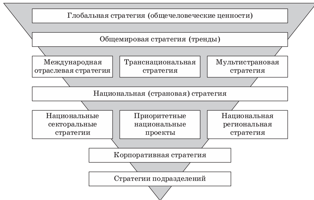
Рис. 2. Иерархическая структура системы стратегий Fig. 2. Hierarchical structure system of strategies

Представляется, что основным элементом системы стратегирования должна быть вариативная экономико-математическая модель, или «цифровой двойник» объекта управления, имеющие в своей основе алгоритмы обработки больших данных и элементы искусственного интеллекта. Используя «цифрового двойника» в качестве инструмента для проведения различных имитационных экспериментов возможно воспроизводить с заданной точностью реально сложившуюся