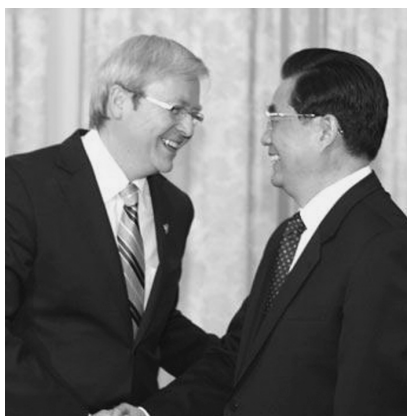
Премьер-министр Австралии К. Радд и председатель КНР говорят на одном языке - китайском. Но Канберра ревностно следит за растущим влиянием Пекина в Океании.

В действительности, единственные легальные источники доходов для островов, в недрах которых отсутствуют какие-либо полезные ископаемые, - это выдача разрешений на лов рыбы в прибрежных водах и экотуризм, не требующий больших первоначальных вложений. Продажа почтовых марок и выпуск эксклюзивных монет для зажиточных