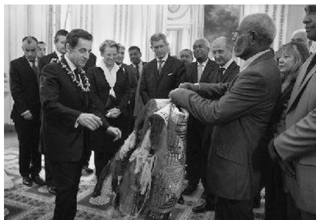
Стремясь сохранить свой статус тихоокеанской державы, Франция в лице президента Н. Саркози (слева) все больше делает упор на почести и помпу.

У Франции в 2008 г. ВВП снизился примерно на 1,5%, в 2009 г.