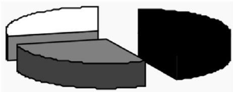
Диаграмма 2. Доля видов республик